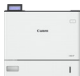
i-SENSYS X 1861P