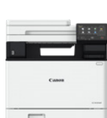
i-SENSYS X C1333iF