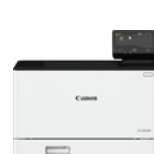
i-SENSYS X C1333P