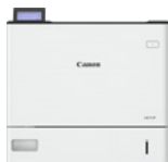
i-SENSYS X 1871P