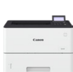
i-SENSYS X 1643P