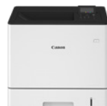
i-SENSYS X C1538P II