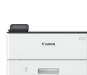
i-SENSYS X 1440Pr