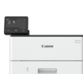
i-SENSYS X 1440P