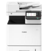
i-SENSYS X C1533iF II