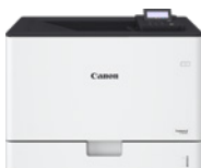
i-SENSYS X C1946P