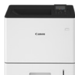
i-SENSYS X C1533P II