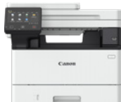
i-SENSYS X 1440i