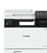
i-SENSYS X C1333i